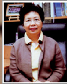
ศ.เกียรติคุณ ดร.อัจฉรา จันทร์ฉาย