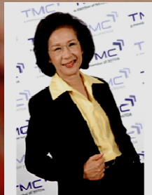
ศ.เกียรติคุณ ดร.ชัชชาติ เทพธรรานนท์